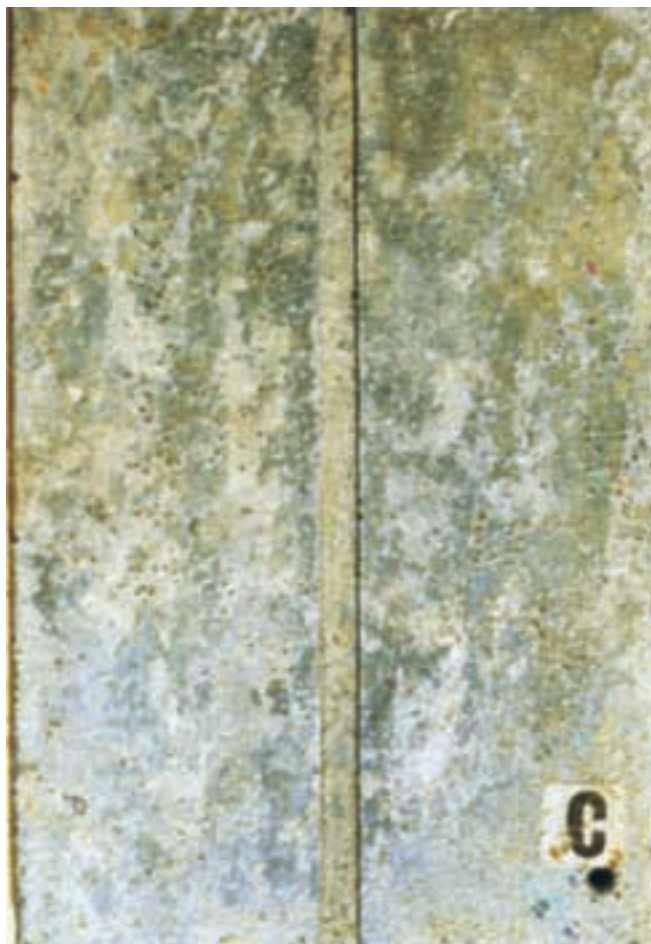
Et 6 mm bredt fræset spor gennem en 60 µm tyk zinkbelægning på stål og eksponeret i 5 år i svært industrimiljø i Holland. Bemærk belægningen af zinksalte i sporet der er uden rustangreb.

Yderligere information ved henvendelse til: