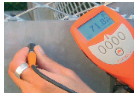
Mätning av zinksiktets tjocklek.

I varmförzinkningsstandarden SS-EN ISO 1461 finns specificerat hur provtagning för skiktjocklekskontroll av varmförzinkat stål ska utföras. Kontrollmätning samt övrig avsyning görs innan godset lämnar varmförzinkningsanläggningen.