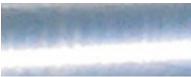
Nyförzinkat gods är ofta blankt.