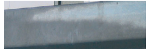
Färgskiftningar i ytan kan förekomma, men påverkar inte kvaliteten på korrosionsskyddet. Anledningen är att reaktionen mellan zink och järn går olika fort beroende på typ av stål samt svalningsförloppet efter förzinkningen.