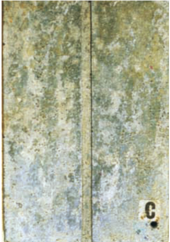
Et 6 mm bredt fræset spor gennem en 60 µm tyk zinkbelægning på stål og eksponeret i 5 år i svært industrimiljø i Holland. Bemærk belægningen af zinksalte i sporet der er uden rustangreb..

Yderligere information ved henvendelse til: