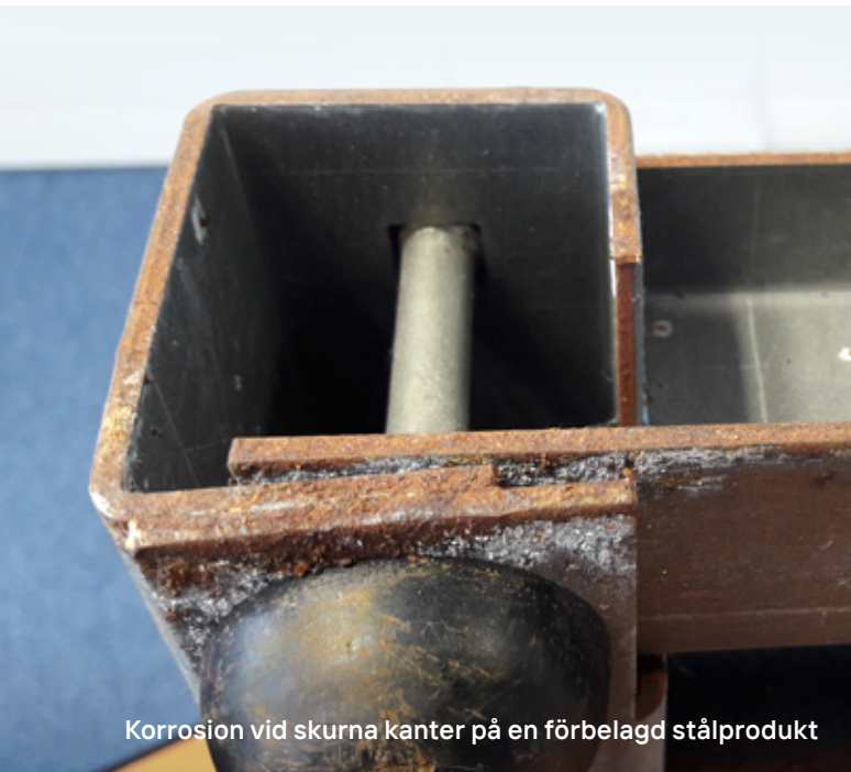
Korrosion vid skurna kanter på en förbelagd stålprodukt