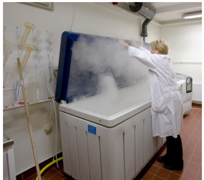
Accelererad korrosionsprovning är inte pålitlig